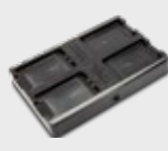
• 94A150074 4-Fach-Akkuladegerät